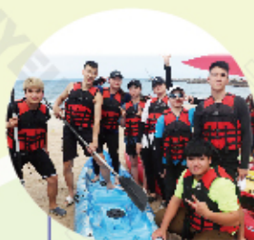
觀光休閒與健康系