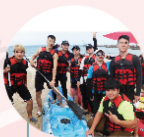
觀光休閒與健康系

ផ្នែកបដិសណ្ឋារកិច្ច និងគ្រប់គ្រងសិល្បៈផ្សេងៗ