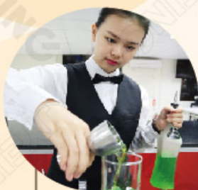
餐旅廚藝管理系 Departemen Perhotelan dan kulinier