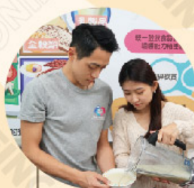
高齡照顧福祉系 Departemen Keperawatan kesejahteraan lansia