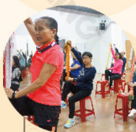
觀光休閒與健康系 Departemen Pariwisata